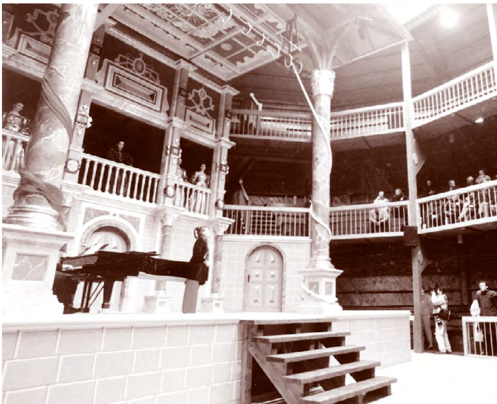
Das Globe-Theater – nachgebaut im Europa-Park Rust bei Freiburg im Breisgau

Flaut: Ne, meiner Seel', lasst mich keine Weiberrolle machen; ich kriege schon einen Bart.