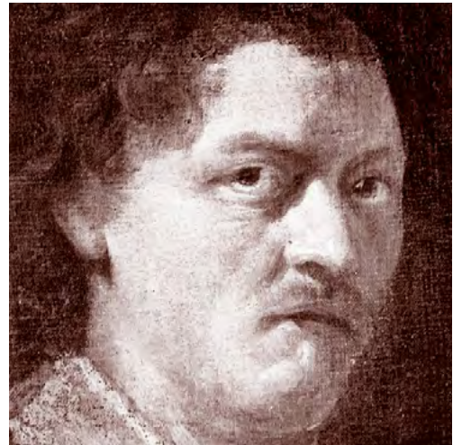
William Sly – Schauspieler im Globe

Vier Shakespeare-Tragödien werden hier ausführlich dargestellt. Und zwar jene, die im Englisch-Unterricht der Sekundarstufe mit Vorzug behandelt werden. Sämtliche Tragödien finden sich in einer Gesamtübersicht im Anschluss daran ganz kurz angerissen, und zwar in der Reihenfolge, in der sie vermutlich entstanden sind.