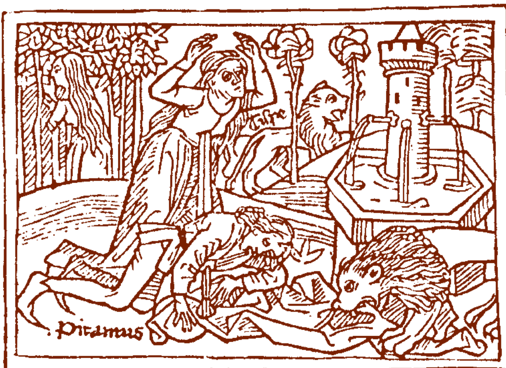
„Pyramus und Thisbe“ – Szene aus dem Sommernachtstraum . Johann Zainer, 1473

Die beliebte Romanze Ein Sommernachtstraum sei hier beispielhaft ausführlich dargestellt. Sämtliche Komödien finden sich in einer Gesamtübersicht im Anschluss daran aufgelistet, und zwar in der Reihenfolge, in der sie vermutlich entstanden sind.